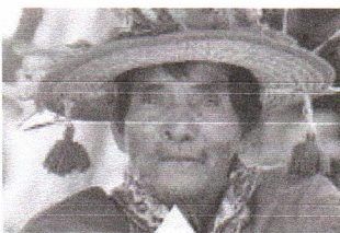
México es uno de los 10 países más ricos en DIVERSIDAD LINGÜÍSTICA

México es uno de los 10 países más ricos en diversidad lingüística, se hablan 68 lenguas indígenas o 364 si se cuentan sus variantes , además de dos lenguas de señas, de acuerdo al Instituto Nacional para la Evaluación de la Educación. Muchas están en riesgo de desaparecer, por lo que se han implementado políticas para la enseñanza de estas lenguas en todos los niveles educativos.